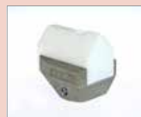
K-5/6 EA K-svar, 5/6 mm Obj. č.: 146.235