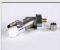
Úhlový adaptér 45° Obj. č.: 153.143