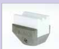
CO-8 EA Rohový svar vnější, 8 mm Obj. č.: 146.642