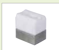
V-5/6 EA V-svar, 5/6 mm Obj. č.: 149.383