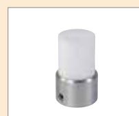
Neopracované Obj. č.: 149.430