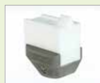
V-12 EA V-svar, 12 mm Obj. č.: 146.243