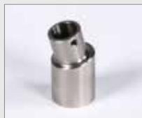
Hrdlo vzduchové, pozice 6h Ø 14 mm Obj. č.: 149.456