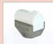
K-8/10 EA K-svar, 8/10 mm Obj. č.: 146.236