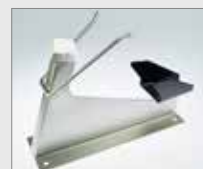
Odkládací stojan pro WELDPLAST S1 Obj. č.: 148.923