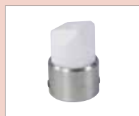
K-12 EA K-svar, 12 mm Obj. č.: 149.401