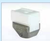
UBL-25 EA Přeplátovací svar, 25 mm Obj. č.: 146.241