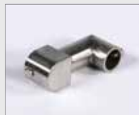
Hrdlo vzduchové, pozice 9h/3h Ø 16 mm Obj. č.: 149.469