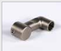
Hrdlo vzduchové, pozice 9h/3h Ø 14 mm (standard) Obj. č.: 149.467