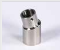
Hrdlo vzduchové, pozice 6h Ø 16 mm Obj. č.: 149.461