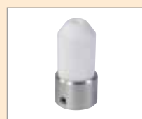
CL-14 EA Rohový svar vnitřní, Ø 14 mm Obj. č.: 149.364