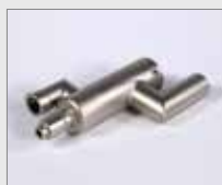
Prodloužení trysky Obj. č.: 152.720