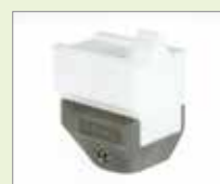
V-15 EA V-svar, 15 mm Obj. č.: 146.244