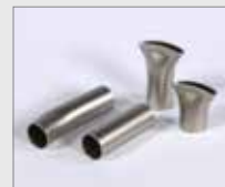
Set násuvných trysek Ø 14 mm (standard) Obj. č.: 154.107