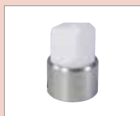
K-8/10 EA K-svar, 8/10 mm Obj. č.: 148.627