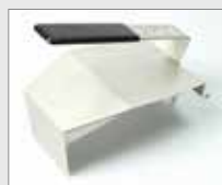
Nahřívací clona Obj. č.: 136.231