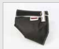
Izolační pouzdro pro S1 / S2 Obj. č.: 154.002