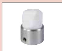
K-5/6 EA K-svar, 5/6 mm Obj. č.: 149.402

K: tvar svaru | 5/6: tloušťka materiálu | EA: externí přehřev