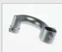
Horní držák přehřevu Obj. č.: 149.600