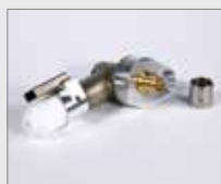
Úhlový adaptér 90° Obj. č.: 153.236