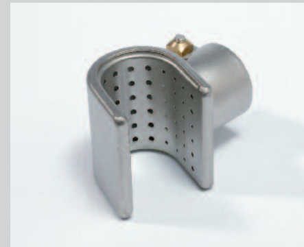
Reflektor U, 20 x 35 mm