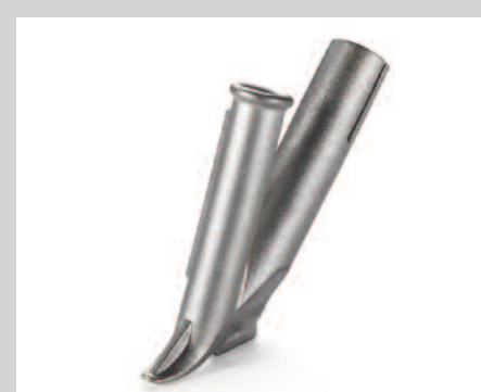
Tryska rychlosvařovací úzká * Ø 3 mm 4 mm 5 mm