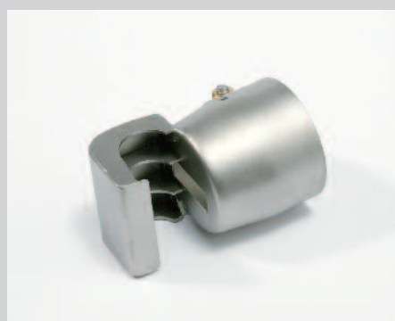
Reflektor odletovací 17 x 34 mm