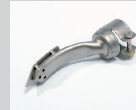
Tryska zažehovací 15 x 25 mm