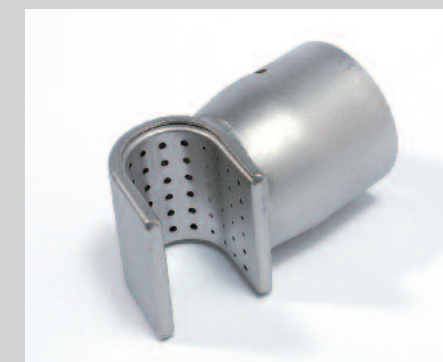
Reflektor U, 35 x 20 mm