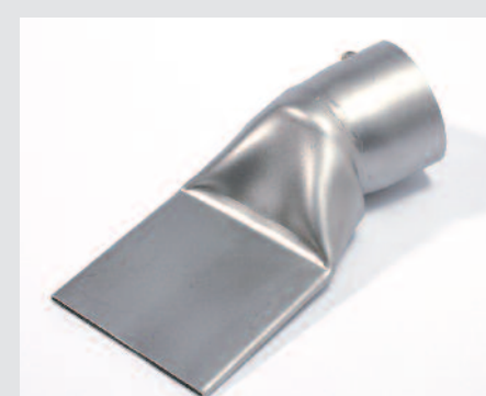
Tryska přepřátovací 75 x 2 mm, včetně opěry (obj.č.: 116.753)