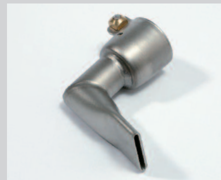
Tryska přepřátovací 20 mm, 90°