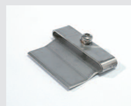
Škrabka, používá se spolu s topnou trubkou (obj.č.: 116.053)