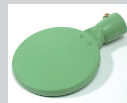
Zrcadlo svařovací 135 mm, potažené PTFE