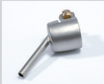
Tryska letovací Ø 4 mm