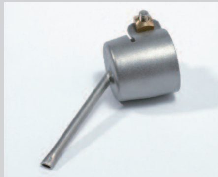
Tryska letovací Ø 3 x 1.5 mm, oválná