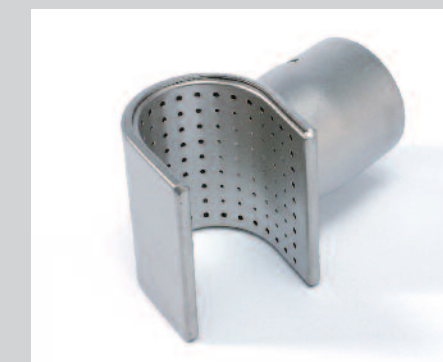
Reflektor U, 50 x 35 mm