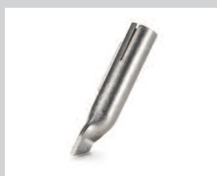
Tryska stehovací *