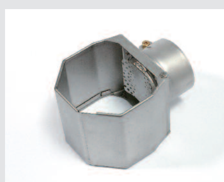
Reflektor otvřací 60 x 75 mm