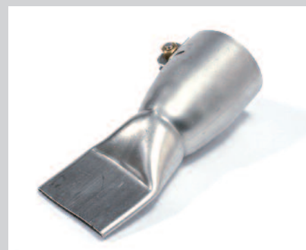
Tryska přepřátovací 40 mm