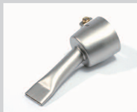
Tryska přepřátovací 20 mm