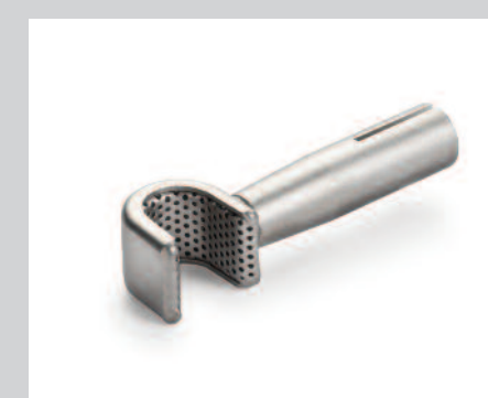
Reflektor U (Ø 8.25 mm) *, 10 x 12 mm