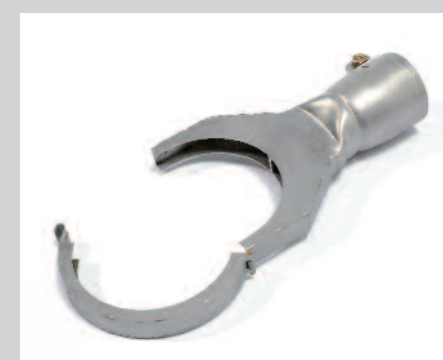
Reflektor otvřací 70 x 12 mm