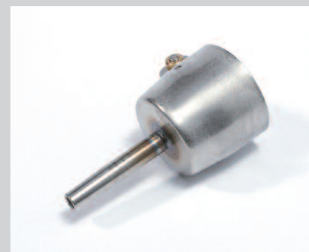
Tryska základní Ø 5 mm