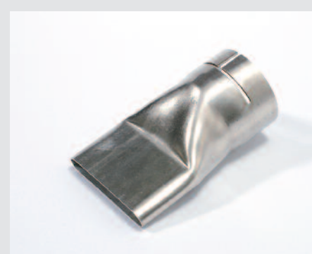
Tryska plochá 70 x 10 mm na bitumeny