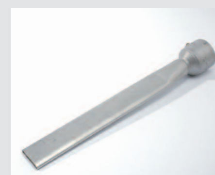
Tryska přepřátovací (pro slévárny) 45 x 12 x 350 mm