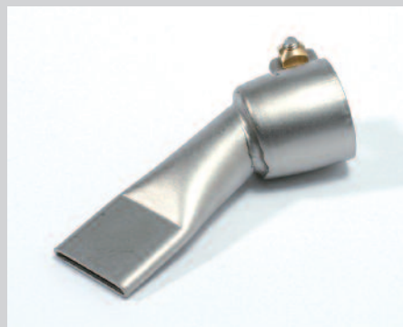
Tryska přepřátovací 20 mm