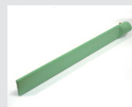
Meč svařovací 74 x 12 x 520 mm, zaoblené hrany, potažený PTFE