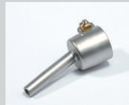
Tryska základní Ø 5 mm