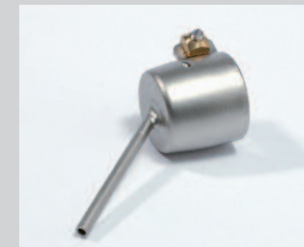
Tryska letovací Ø 2 mm