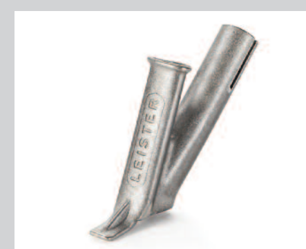
Tryska rychlosvařovací trojúhelníková * 5.7 mm 7 mm