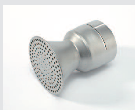
Reflektor děrovaný Ø 65 mm