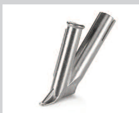
Tryska rychlosvařovací * Ø 3 mm 4 mm 5 mm