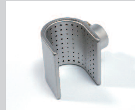
Reflektor U, 50 x 35 mm