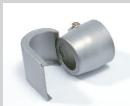
Reflektor lžicový 25 x 30 mm