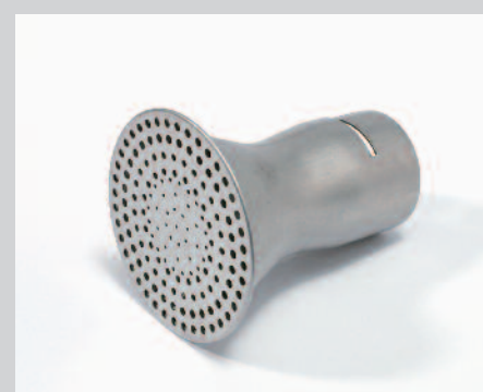
Reflektor děrovaný Ø 65 mm