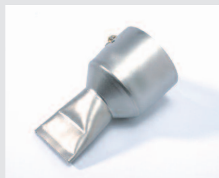
Tryska páskovací 40 mm, na bitumeny