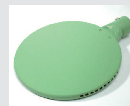
Zrcadlo svařovací 270 mm, potažený PTFE