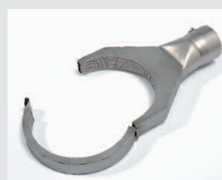
Reflektor otvřací 125 x 22 mm