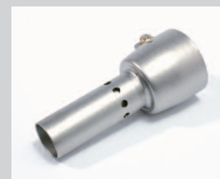
Tryska odrohovací (na zviřata)