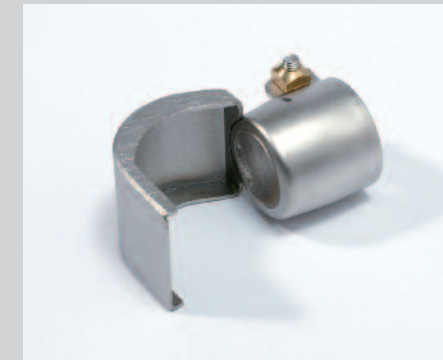
Reflektor lžicový 25 x 30 mm