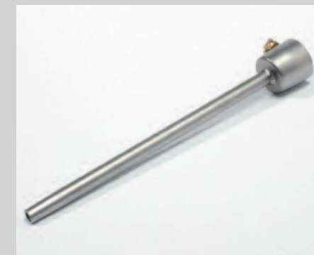
Tryska základní Ø 5 x 150 mm, prodloužená