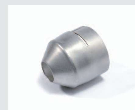
Tryska kulatá - deflektor 20 mm