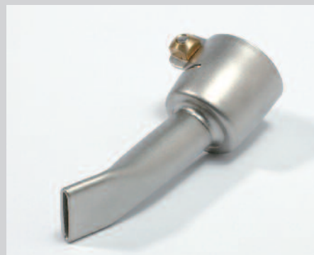
Tryska přepřátovací 15 mm