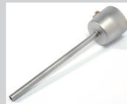
Tryska základní Ø 5 x 130 mm, prodloužená