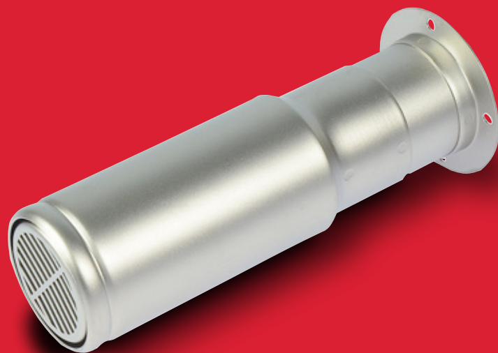
Topná část s ochrannou trubkou