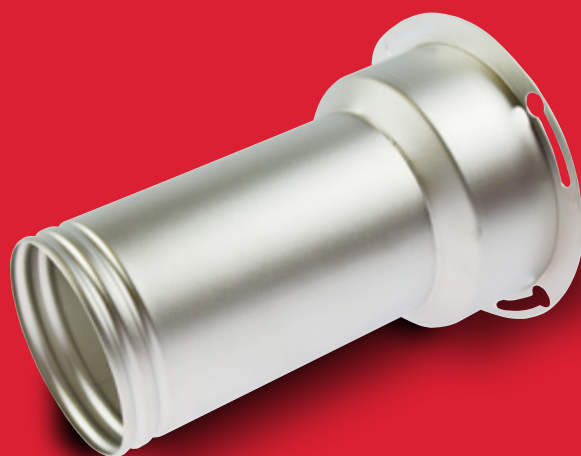
Adaptér s ochrannou trubkou