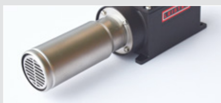
Topná část s ochrannou trubicí