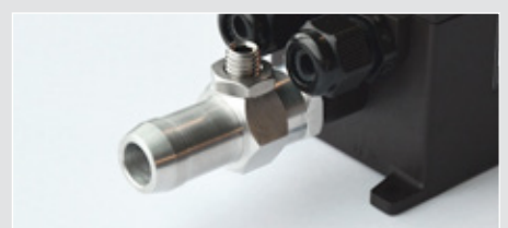
Přípojka na tlakový vzduch s redukčním ventilem